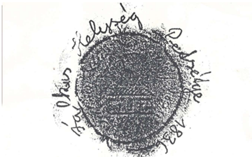
Pečať z roku 1836