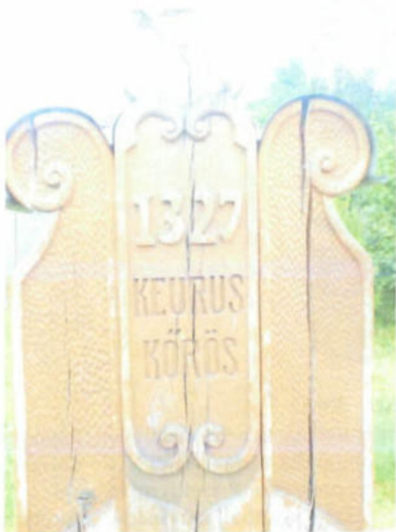
Pamätný stĺp v obci Kružná