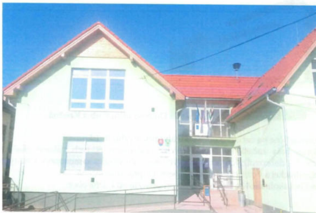
Obecný úrad v Kružnej

V súčasnosti v budove na prízemí sídli obecný úrad, a na poschodí je vytvorená remeselnícka izba a zariadená knižnica.