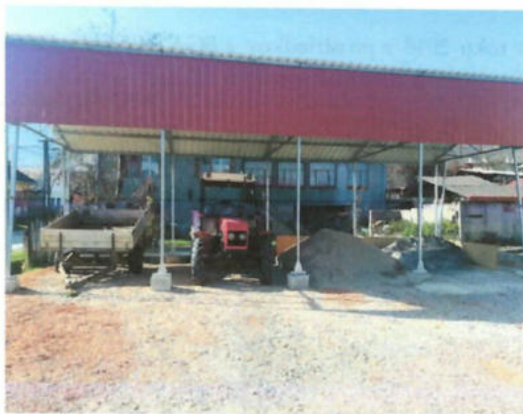
Parkovisko pre obecný traktor a autobus