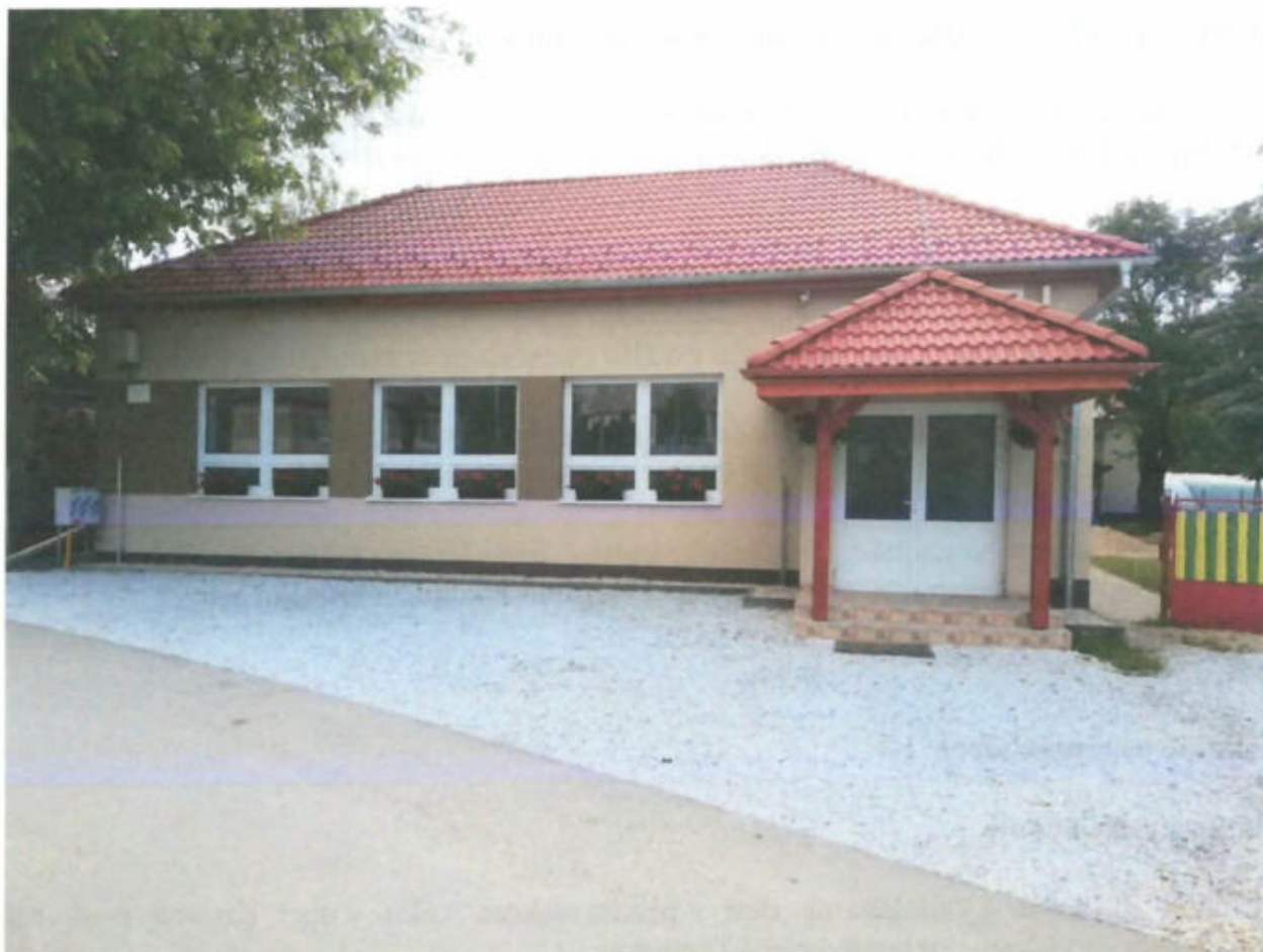
Spoločenský dom v obci Kružná