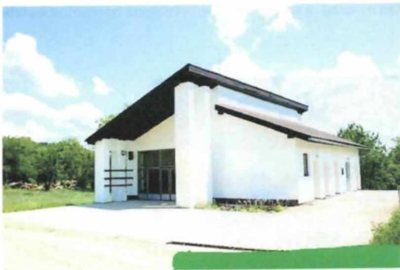
Dom smútku v obci Kružná

Stavba Domu smútku bola začatá v roku 1995. Dom smútku bol uvedený do prevádzky len v roku 1998. Kolaudácia stavby bola v roku 2009. Slávnostné odovzdanie Domu smútku do užívania sa uskutočnilo dňa 1. augusta 2009 pri príležitosti V. Dňa obce Kružná.