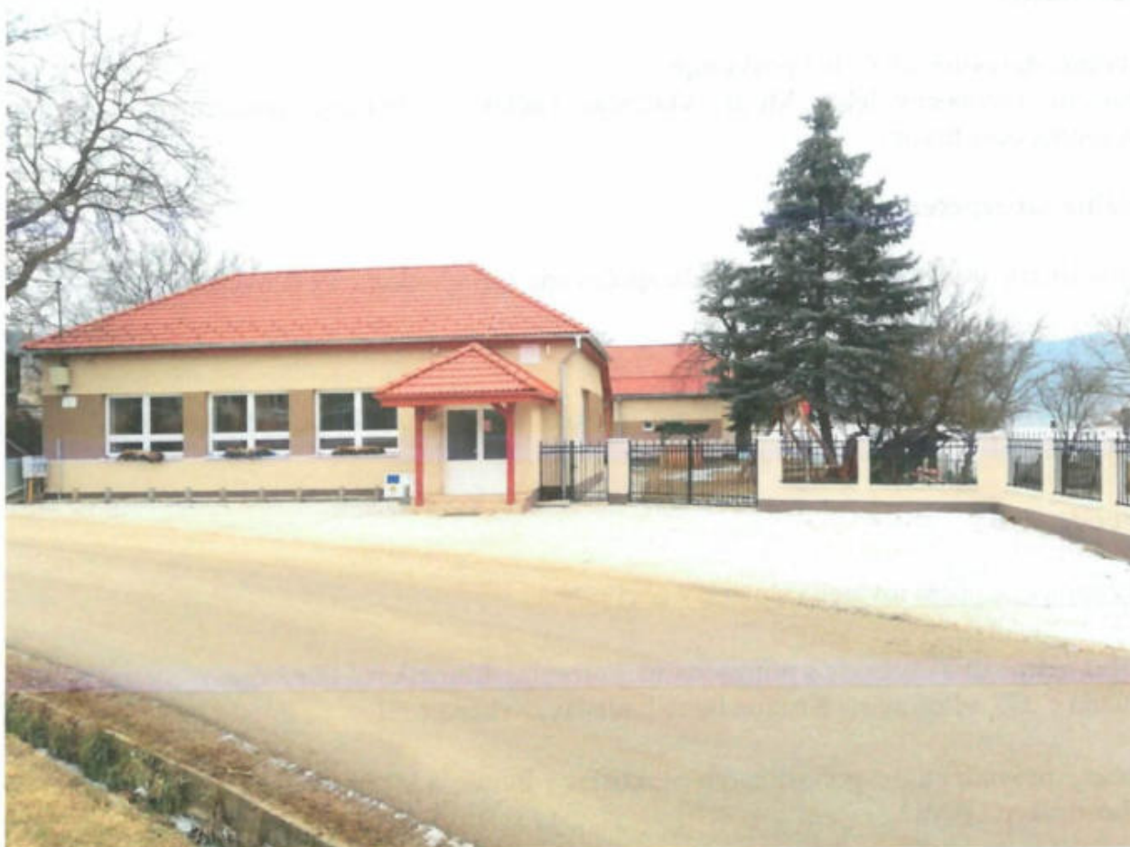
Spoločenský dom v obci Kružná