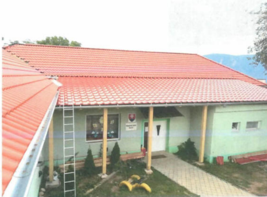
Materská škôlka v Kružnej

V rámci rekonštrukcie budovy MŠ sa uskutočnila výmena strechy, dverí a okien na budove materskej škôlky, pre deti našej obce a pre deti navštevujúcich našu MŠ sa uskutočnila výstavba detského ihriska so šiestimi hracími prvkami.