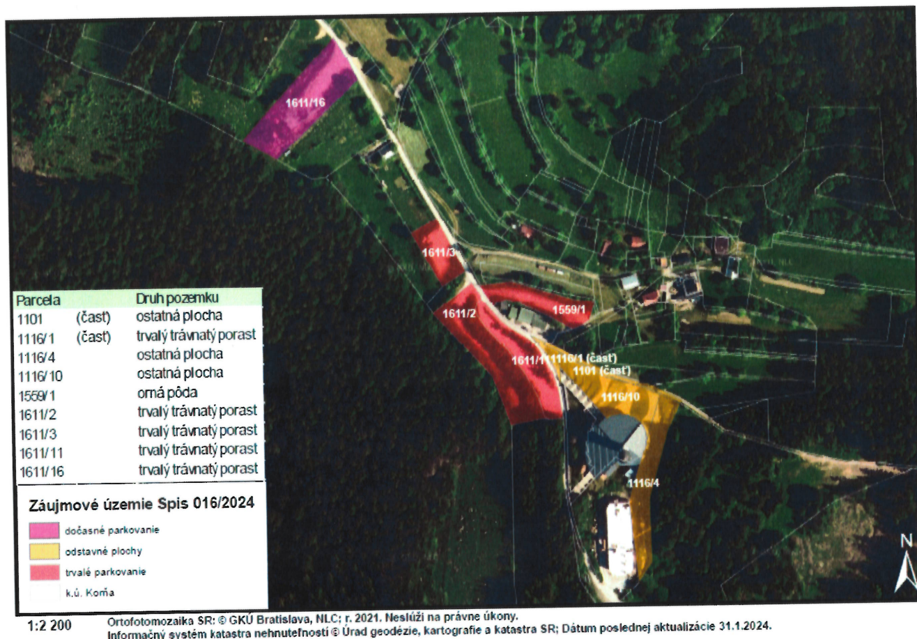
Mapa č. 1 Zájmové územie k. ú. Korňa

Zájmové územie sa nachádza v CHKO Kysuce, kde platí druhý stupeň ochrany podľa zákona OPaK. V zmysle R-USES okresu Čadca územie zasahuje do regionálneho biokoridoru RBk1. Umiestnenie navrhovanej činnosti sa nachádza mimo európskej siete chránených území NATURA 2000.