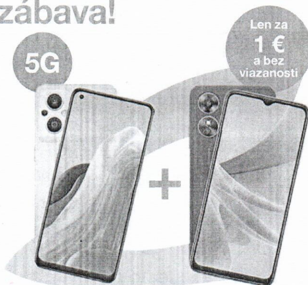
OPPO Reno7 Lite 5G